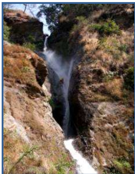
La C80 finale de Fangfung Khola