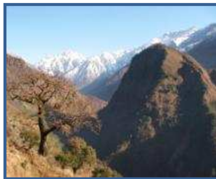
La vallée de la Marsyangdhi