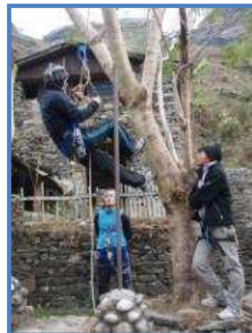
Exercices technique lors du stage de formation 2008