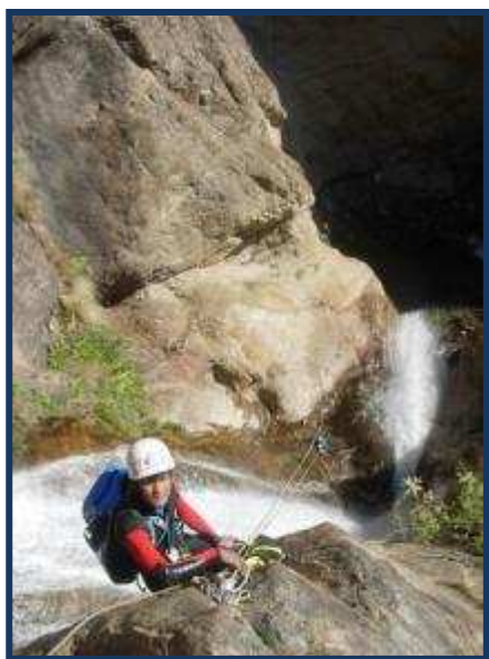
Le premier obstacle de Raindu Khola