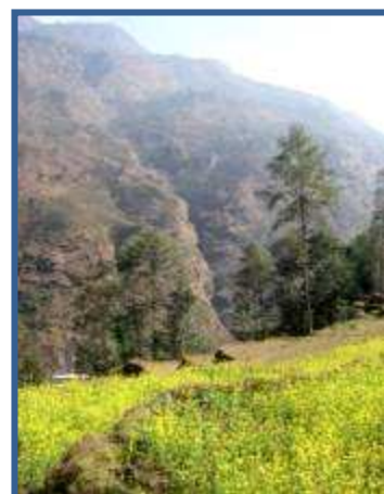
Paysage dans la Bhote Khosi

Ils pratiquent donc le canyon, la spéléologie, l'escalade et, après un stage en eaux vives et plusieurs en milieu professionnel avec les membres des expéditions, valident en juin 2006 l'Attestation de Formation aux Premiers Secours (AFPS) et le Monitorat Fédéral Canyon de l'EFC. Ils sont toujours les seuls népalais à posséder un tel diplôme.