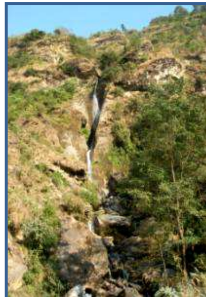
La C80 final de Fangfung Khola