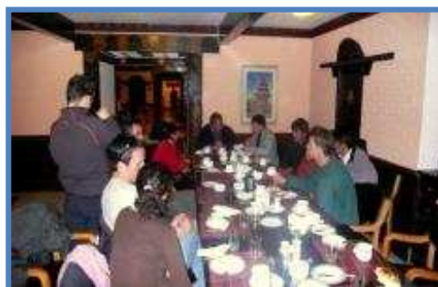
Réunion de travail avec les membres de la NCA et le président de l'EFC pour préparer le stage de formation en 2008

Nous avons eu la grande chance de trouver en les membres de la NCA des personnes particulièrement motivés et efficaces. Le travail de préparation et d'organisation effectué par la NCA lors du stage de formation et de la démonstration 2008 (programmation, invitations des officiels, transport, assurances, sponsors, communication...) a été d'une redoutable efficacité et l'association est à coup sûr un partenaire fiable et particulièrement dynamique. Elle a d'ailleurs déjà envoyé des délégués la représenter lors de rassemblement internationaux canyon, aux Etats-Unis (2006 et 2007) et en France (2008).