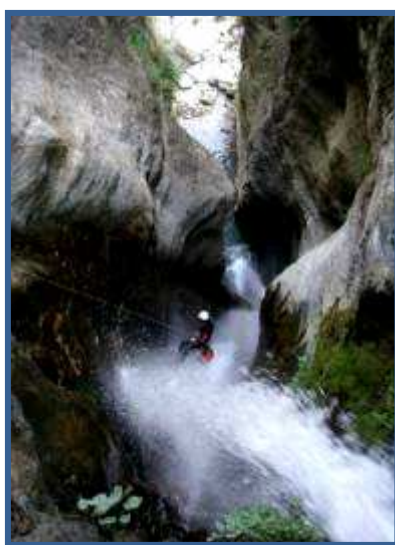
L'encaissement final de Kabre Khola, Bhote Khosi