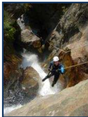
Le guidé final de Sansapu inf...